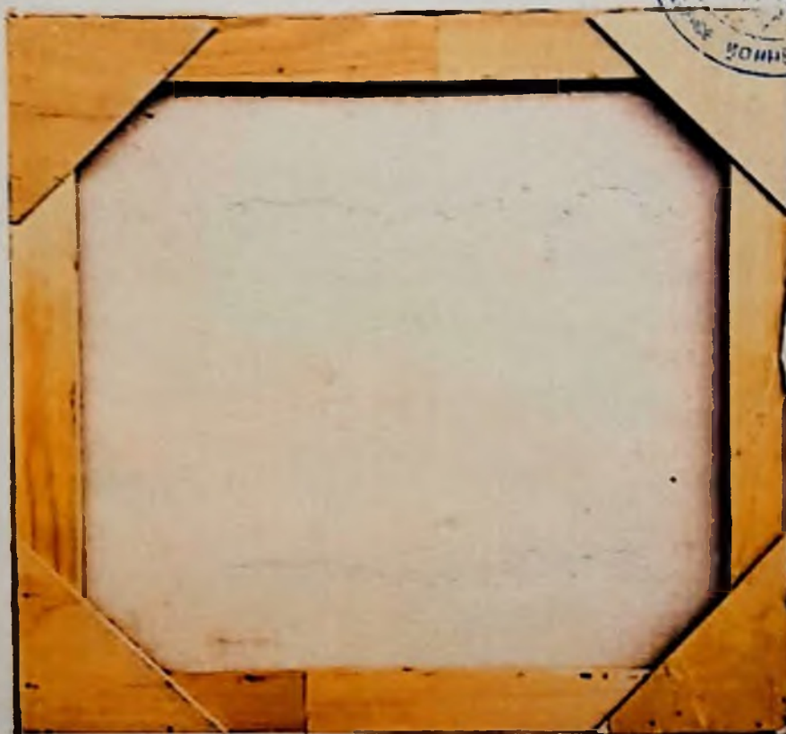
Общий вид оборотной стороны