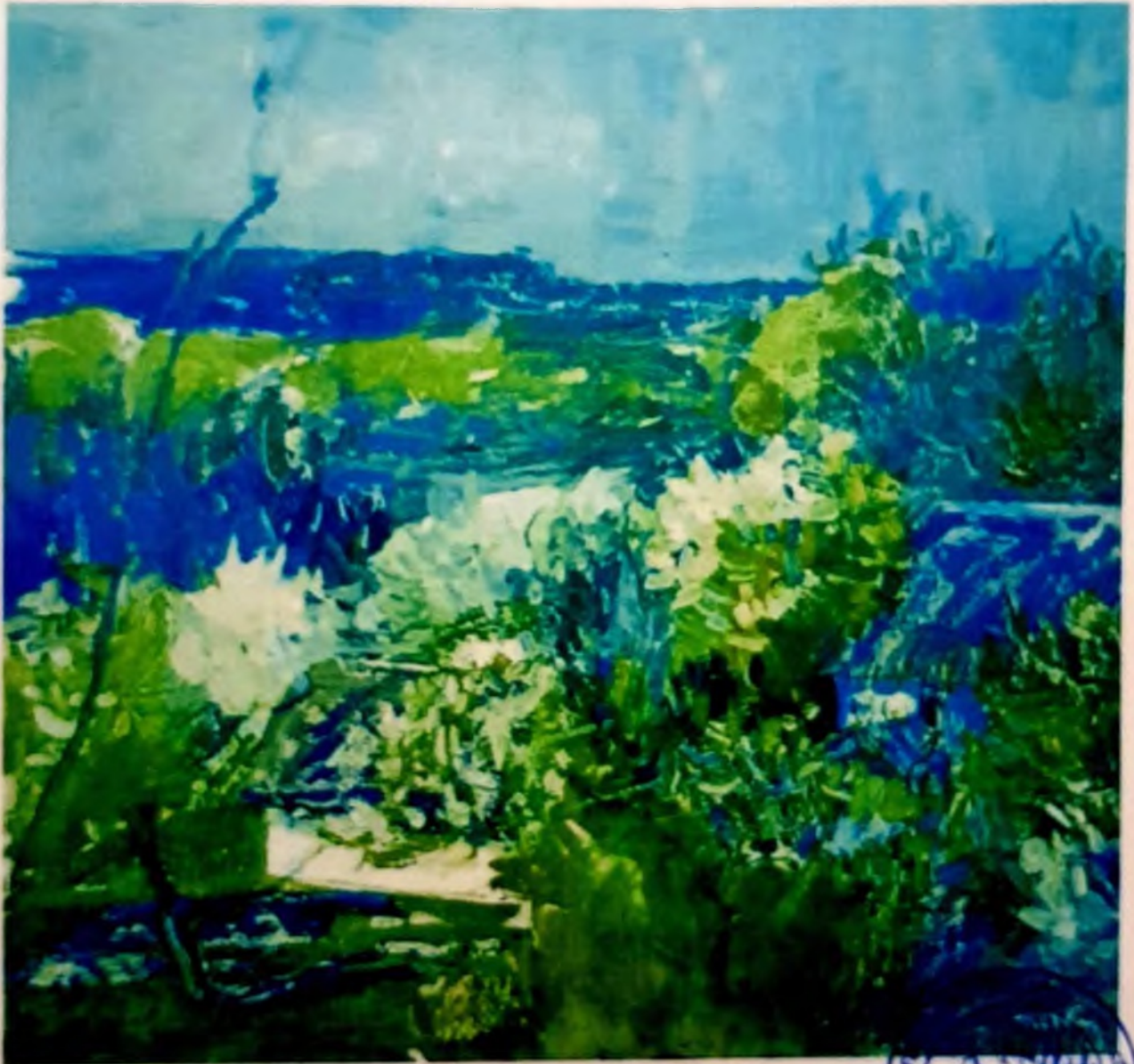
Общий вид лицевой стороны

Время создания XX век холст, масло 52x56