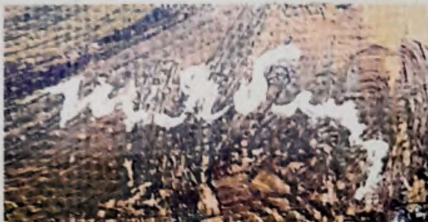
Фрагмент лицевой стороны